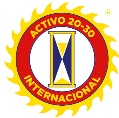
SPANISH ACTIVO 20-30 INTERNACIONAL®