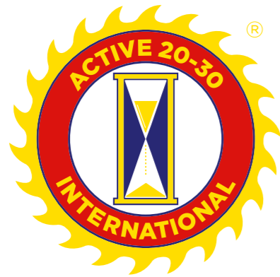
ENGLISH ACTIVE 20-30 INTERNATIONAL®

Since we are an international organization that is part of Spanish and English-speaking countries throughout the American continent, the official languages for the organization are English and Spanish. The organization was born in the United States; therefore, the primary emblem is the one in English; nonetheless, the Latin American countries can implement the emblem in Spanish.