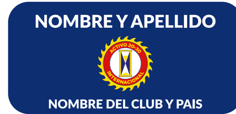
Placa Identificación Para Todo Socio (A)

A continuación, una muestra de las placas confeccionadas y actuales en la organización: