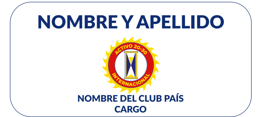
Placa Identificación Para Oficiales Nacional e Internacional