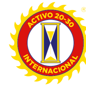
FULL COLOR SIN FONDO

Con el objetivo de conservar el buen manejo del logo de Activo 20-30 Internacional es muy importante conocer el uso correcto de las variables permitidas, que responden gráficamente a las diferentes variables de fondos e imagen, además del uso correcto de los colores corporativos como fondo. Siempre que sea posible y como uso principal del logotipo se sugiere implementar los colores de la organización corporativos: rojo, azul y amarillo.