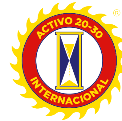
ESPAÑOL ACTIVO 20-30 INTERNACIONAL®