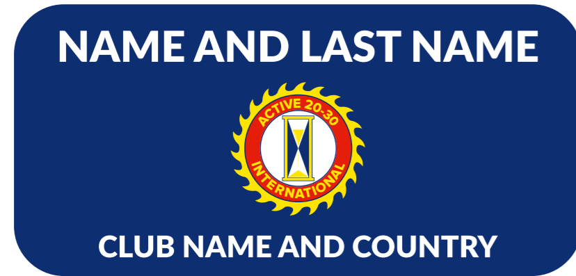
Nameplate to identify all members

The following are samples of the nameplates used in the organization: