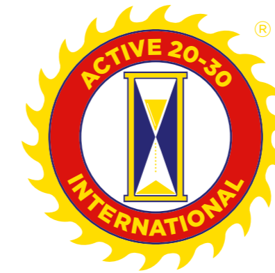
INGLÉS ACTIVE 20-30 INTERNATIONAL®

Al tratarse de una organización internacional que se encuentra en varios países del continente Americano los idiomas oficiales son inglés y español. Considerando que dio sus inicios en los Estados Unidos de América el logotipo primario y global es el que contiene la leyenda en inglés, sin embargo cada país latino implementa su leyenda en español. Por tanto para el presente Manual de imagen el logotipo se muestra en ambos lenguajes, con los siguientes escritos: