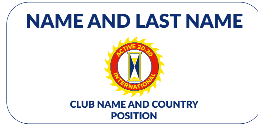
Nameplate for National and International Officers